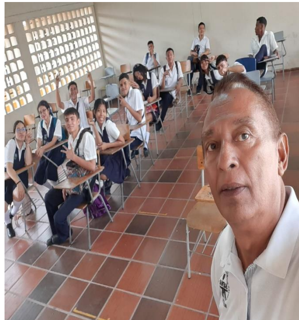
Actividad: Realización de una Evaluación de Conocimientos sobre La Implementación Del Sistema De Gestión De Seguridad y Salud En El Trabajo y El Manejo Seguro De Sustancias Químicas