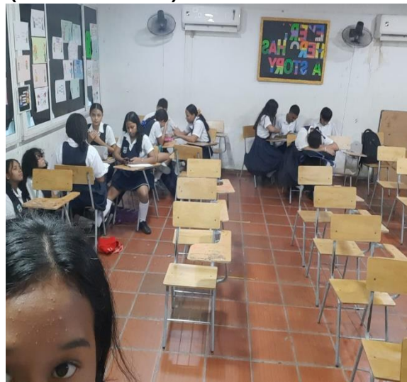
Actividad asignada por grupo -Desarrollo de un Taller Evaluativo de conocimientos sobre La Implementación DEL SG-SST EN UNA EMPRESA y MANEJO SEGURO DE PRODUCTOS QUÍMICOS, durante la formación.