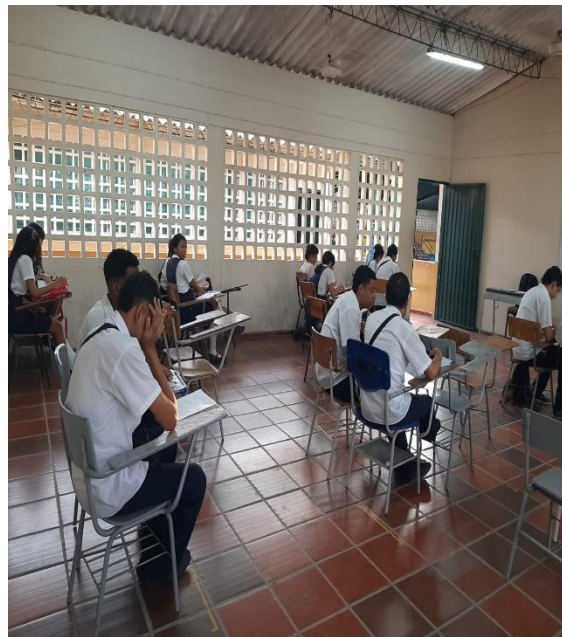
Actividad: Realización de una Evaluación de Conocimientos sobre La Implementación Del Sistema De Gestión De Seguridad y Salud En El Trabajo y El Manejo Seguro De Sustancias Químicas