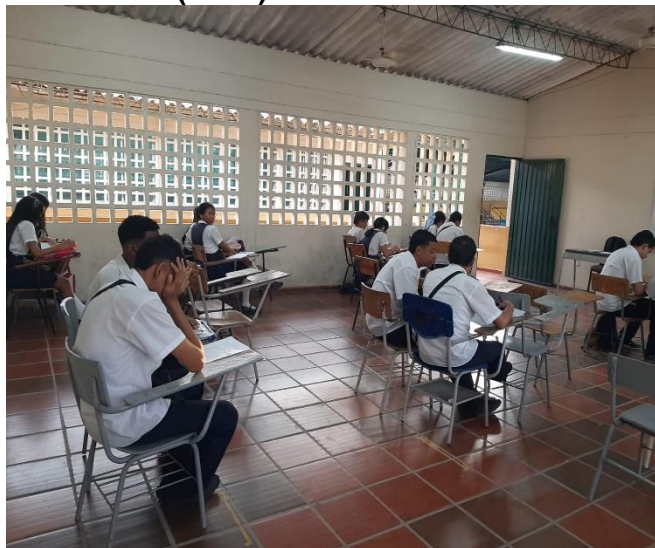
Actividad asignada por grupo -Desarrollo de un Taller Evaluativo de conocimientos sobre La Implementación DEL SG-SST EN UNA EMPRESA y MANEJO SEGURO DE PRODUCTOS QUÍMICOS, durante la formación.