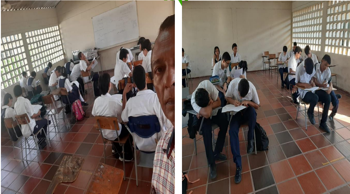
Actividad: Realización de una Evaluación de Conocimientos sobre La Implementación Del Sistema De Gestión De Seguridad y Salud En El Trabajo y El Manejo Seguro De Sustancias Químicas