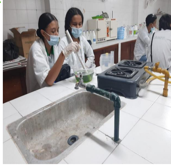
Actividad productiva: Elaboración de 10 litros de Detergente Líquido Lavalozza, teniendo en cuenta la aplicación de Los Protocolos De Bioseguridad