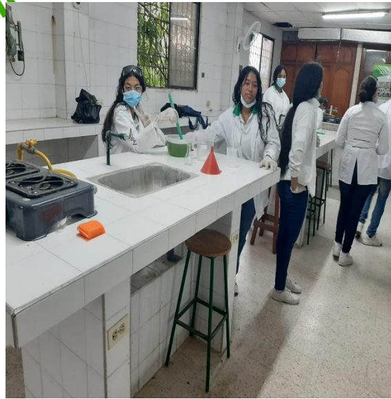
Actividad productiva: Producción de 10 Litros Detergente Líquido Lavalozza, teniendo en cuenta Los Protocolos De Bioseguridad