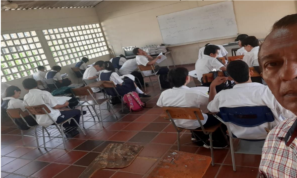
Actividad asignada por grupo -Desarrollo de un Taller Evaluativo de conocimientos sobre La Implementación DEL SG-SST EN UNA EMPRESA y MANEJO SEGURO DE PRODUCTOS QUÍMICOS, durante la formación.