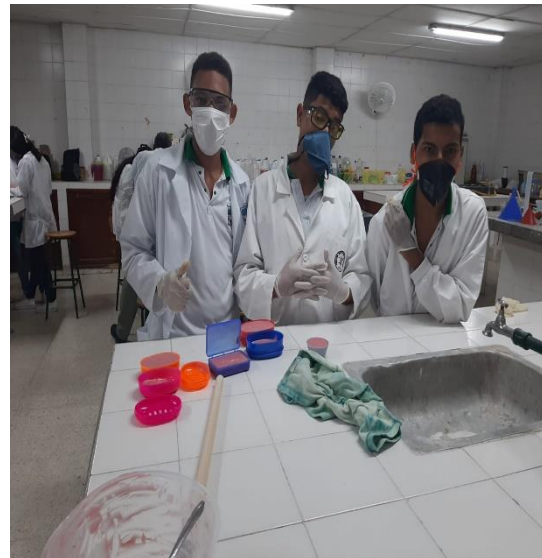
Actividad productiva: Elaboración de jabón en barra para lavado de ropa (proceso de saponificación)