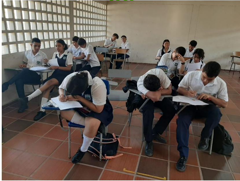
Actividad: Realización de una Evaluación de Conocimientos sobre La Implementación Del Sistema De Gestión De Seguridad y Salud En El Trabajo y El Manejo Seguro De Sustancias Químicas