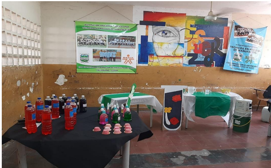
Actividad práctica sobre la producción de 5 litros de Detergente Líquido para lavado de Loza y Comercialización de productos Químicos de Aseo, Higiene y Limpieza durante La Celebración de los 50 Años de la I.E.