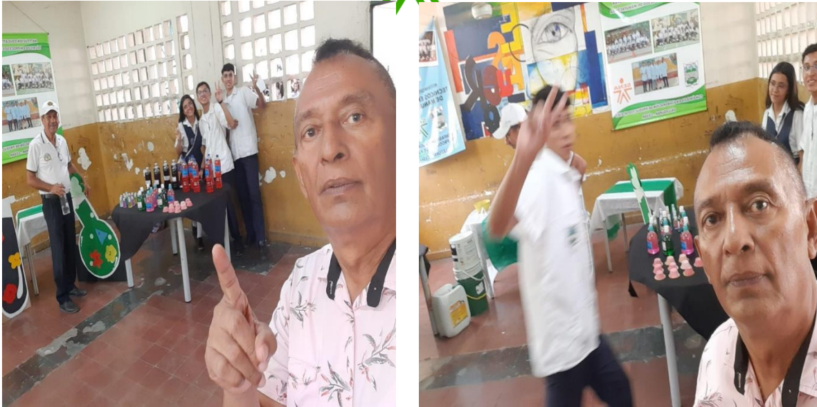
Actividad práctica sobre la producción de 5 litros de Detergente Líquido para lavado de Loza y Comercialización de productos Químicos de Aseo, Higiene y Limpieza durante La Celebración de los 50 Años de la I.E.