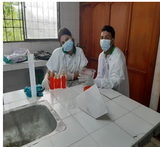
Actividad: Práctica: Fabricación de Ambientador Líquido tipo Spray con diversos aromas