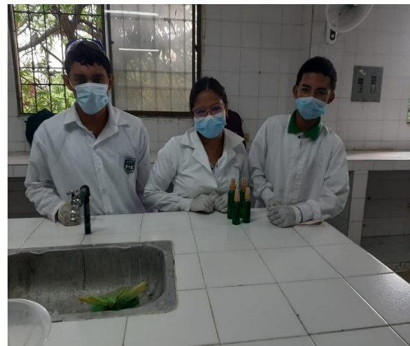
Actividad práctica: Elaboración por cada grupo, de 600 ml de Ambientador Líquido tipo Spray