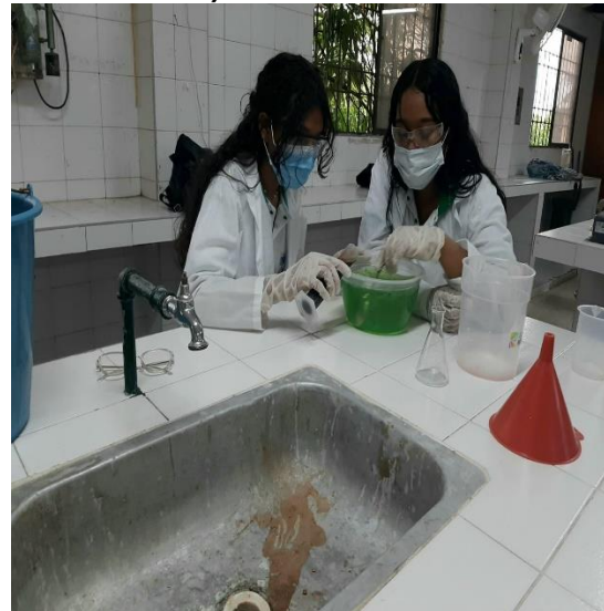
Actividad práctica en grupo: Elaboración de 4,0 litros de Detergente Líquido para Lavado de Loza