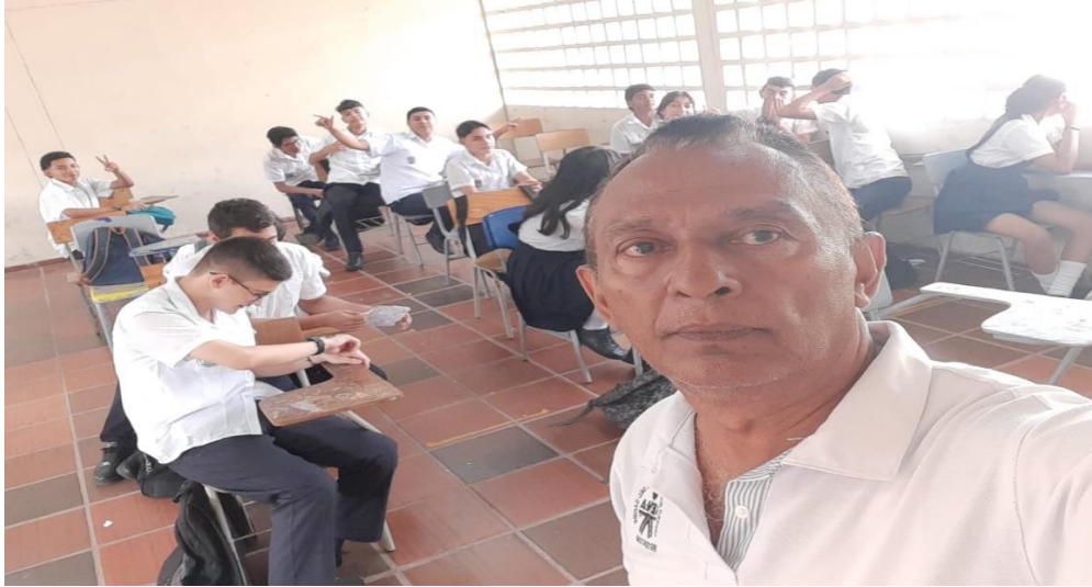
Actividad: Revisión y confirmación de datos personales de los aprendices para inscripción en la Agencia Pública de Empleo - APE