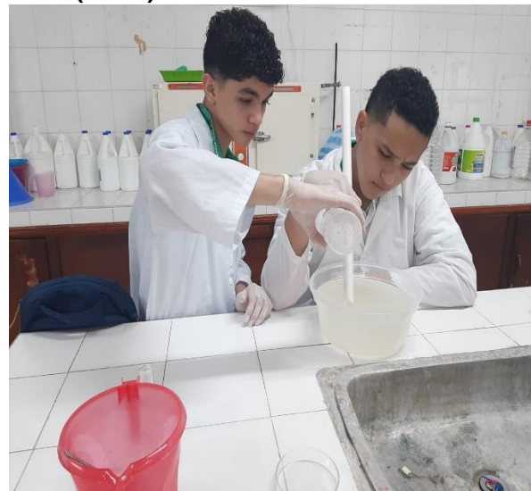
Actividad asignada por grupo -Elaboración de Detergente Líquido para Pisos y Comercialización de productos químicos de aseo en la sede GALAN