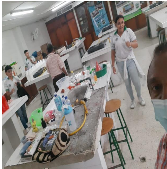
Actividad: Homogenización, envasado y etiquetado de diversos productos para su comercialización