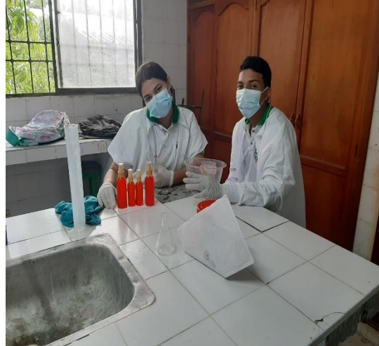
Actividad: Práctica: Fabricación de 600 ml de Ambientador Líquido tipo Spray con diversos aromas