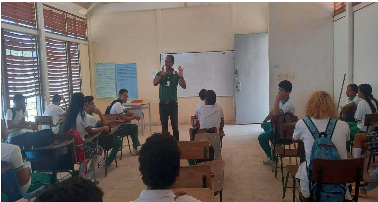
SOCIALIZACION DEL PROGRAMA DE FORMACION PROMOTORIA EN MANEJO AMBIENTAL EN LOS GRADOS 10-4 EN LA INSTITUCION EDUCATIVA BENITOS RAMOS TRESPALACIO AÑO 2024.