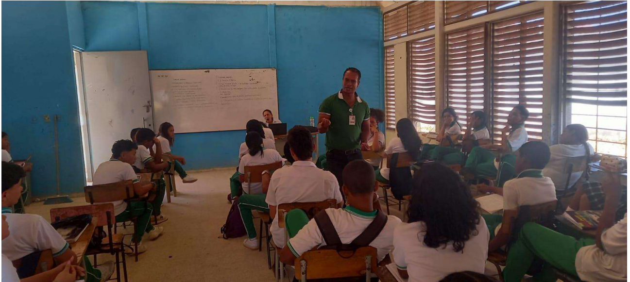
SOCIALIZACION DEL PROGRAMA DE FORMACION PROMOTORIA EN MANEJO AMBIENTAL EN LOS GRADOS 10-5 EN LA INSTITUCION EDUCATIVA BENITOS RAMOS TRESPALACIO AÑO 2024.