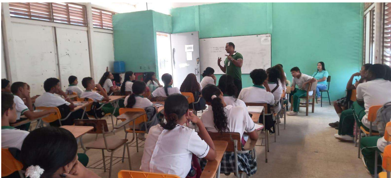
SOCIALIZACION DEL PROGRAMA DE FORMACION PROMOTORIA EN MANEJO AMBIENTAL EN LOS GRADOS 10-3 EN LA INSTITUCION EDUCATIVA BENITOS RAMOS TRESPALACIO AÑO 2024.