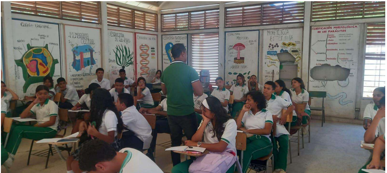
REUNION DE ALISTAMIENTO CON LA COORDINADORA ACADEMICA DE LA INSTITUCION EDUCATIVA RAFAEL URIBE URIBE DEL CORREGIMIENTO DE MEDIA LUNA .