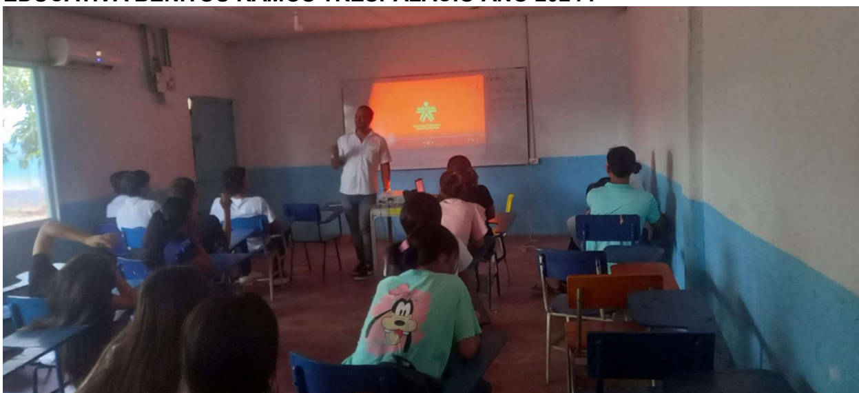
FICHA : 2921463 FORMACION PROMOTORIA EN MANEJO AMBIENTAL EN LA INSTITUCION EDUCATIVA BENITOS RAMOS TRESPALACIO AÑO 2024.