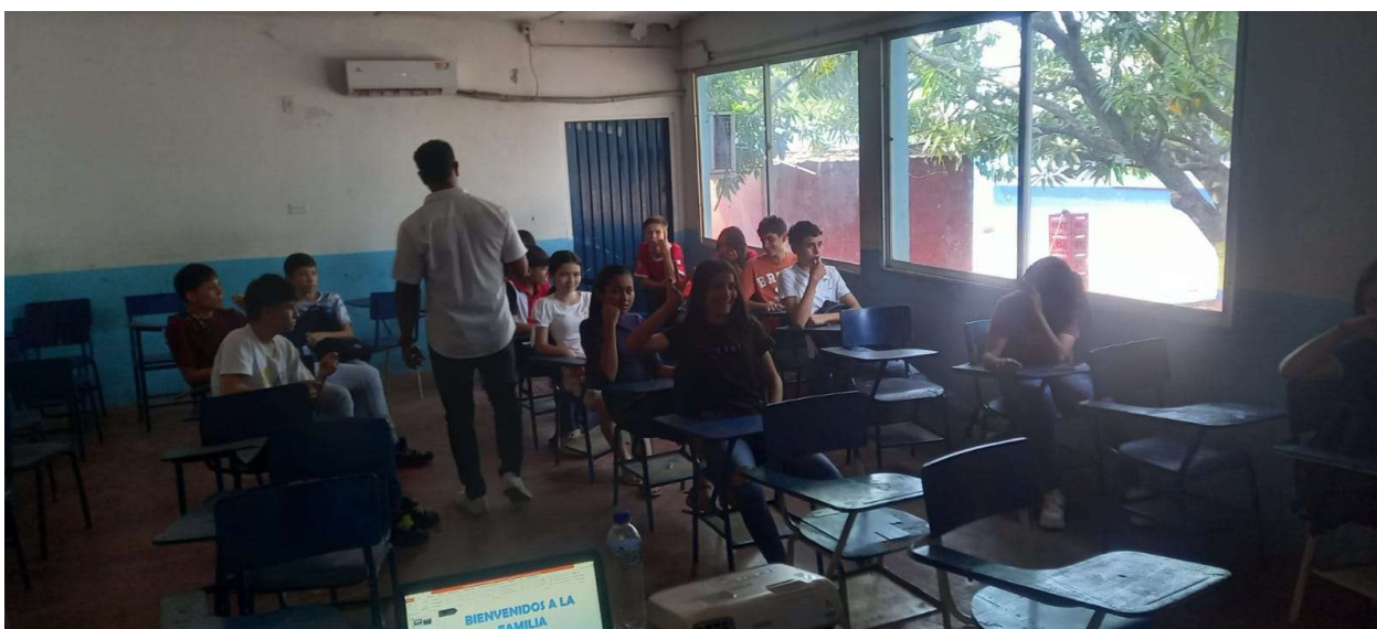
FICHA :2921463 PROMOTORIA EN MANEJO AMBIENTAL EN LOS GRADOS 10-5 EN LA INSTITUCION EDUCATIVA BENITOS RAMOS TRESPALACIO AÑO 2024.