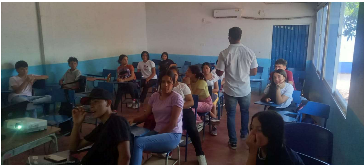
FICHA : 2921453 PROMOTORIA EN MANEJO AMBIENTAL EN LA INSTITUCION EDUCATIVA BENITOS RAMOS TRESPALACIO AÑO 2024 .