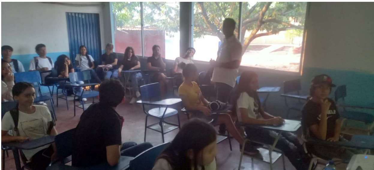
FICHA : 2921413 FORMACION PROMOTORIA EN MANEJO AMBIENTAL EN LA INSTITUCION EDUCATIVA BENITOS RAMOS TRESPALACIO AÑO 2024.