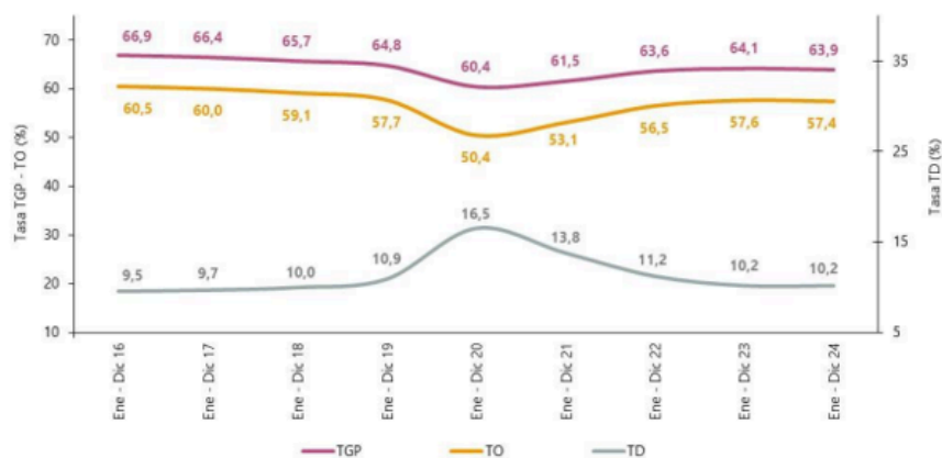
Gráfica No. 2. Tasa global de participación (TGP), Tasa de ocupación (TO) y Tasa de desocupación (TD) Total 13 ciudades y áreas metropolitanas Enero - diciembre (2016 - 2024)

En el 2024, la tasa de desocupación en el total de las 13 ciudades y áreas metropolitanas fue 10,1%, en el año 2023 fue 10,4%. La tasa global de participación se ubicó en 66,7%, lo que representó un aumento de 0,3 puntos porcentuales respecto al año de 2023 (66,3%). Finalmente, la tasa de ocupación fue 59,9%, lo que representó un aumento de 0,5 puntos porcentuales respecto al año de 2023 (59,5%).