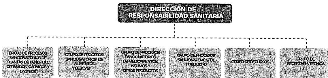
Esquema 1. Estructura de la Dirección de Responsabilidad sanitaria

Es pertinente aclarar que una vez la Dirección de Responsabilidad Sanitaria del INVIMA, tiene conocimiento sobre los hechos constitutivos de presuntas infracciones al régimen sanitario, bien sea a través de quejas y denuncias, en donde se realizó la aplicación de alguna de las medidas sanitarias, señaladas en el artículo 576 de la ley 9ª de 1979, o en virtud de un informe presentado por otras autoridades públicas como: la Fiscalía General de la Nación, la Procuraduría General de la Nación, la Contraloría General de la República, los jueces de la República u otras autoridades administrativas; evalúa el mérito para iniciar el procedimiento administrativo sancionatorio, de conformidad con la información recibida.