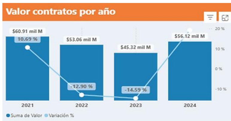
Gráfico. Gasto anual categoría de servicios culturales y becas. Cifras en miles de millones COP