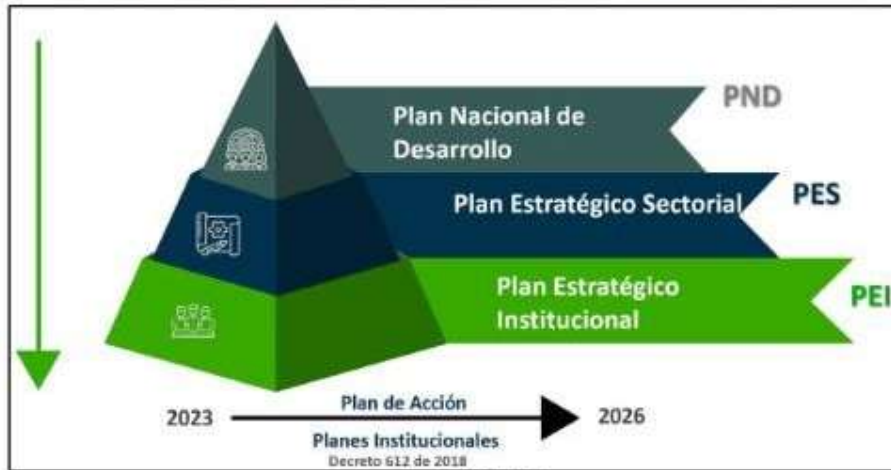
Ilustración 2 Alineación normativa PEI 2023 – 2026

que se llevarán a cabo para los propósitos del Plan de Acción, están soportadas en las Bases del Plan Nacional de Desarrollo PND 2022-2026 Colombia Potencia Mundial de la vida, con sus correspondientes pilares, transformaciones e implicaciones: