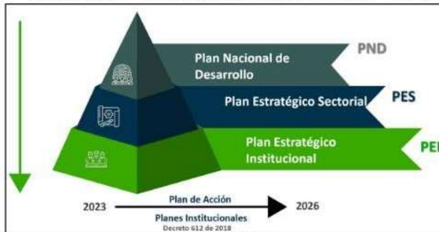
Ilustración 2 Alineación normativa PEI 2023 – 2026

Plan Nacional de Desarrollo PND 2022-2026 Colombia Potencia Mundial de la vida, con sus correspondientes pilares, transformaciones e implicaciones: