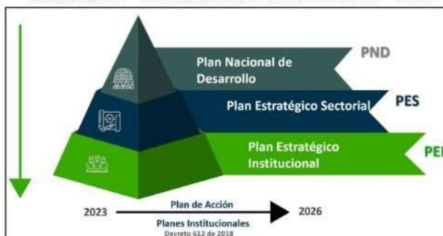
Ilustración 2 Alineación normativa PEI 2023 – 2026

Conforme a los lineamientos del Plan de Acción 2023-2026, Sembrando el Cambio: Por la inclusión, la sostenibilidad, y la seguridad humana ; se propone realizar esfuerzos orientados a garantizar que todas las acciones y recursos de la entidad estén alineadas al plan estratégico institucional 2023 – 2026 y enfocados en atender su propósito fundamental. Por consiguiente, corresponde a la Dirección General de manera conjunta con las Direcciones Regionales y Centros de Formación llevar a cabo actuaciones encaminadas al cumplimiento de los objetivos. Todas las actuaciones que se llevarán a cabo para los propósitos del Plan de Acción, están soportadas en las Bases del Plan Nacional de Desarrollo PND 2022-2026 Colombia Potencia Mundial de la vida, con sus correspondientes pilares, transformaciones e implicaciones: