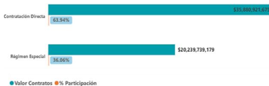
Gráfico. Contratos por modalidad de contratación Categoría Servicios Culturales y Becas 2024

En el año 2022 hubo una disminución de contratación del 65%, para este periodo el distrito opto por realizar más convenios de asociación y menos contratación directa lo cual repercute de manera directa en el presupuesto de la categoría, haciendo que los asociados hagan aportes significativos a los procesos tanto en dinero como en especie, lo cual beneficia la comunidad impactada por los procesos suscritos por el Distrito; para el 2023 regresa a la tendencia histórica y para el 2024 hubo un incremento del 4.66% representados en 10 MM.