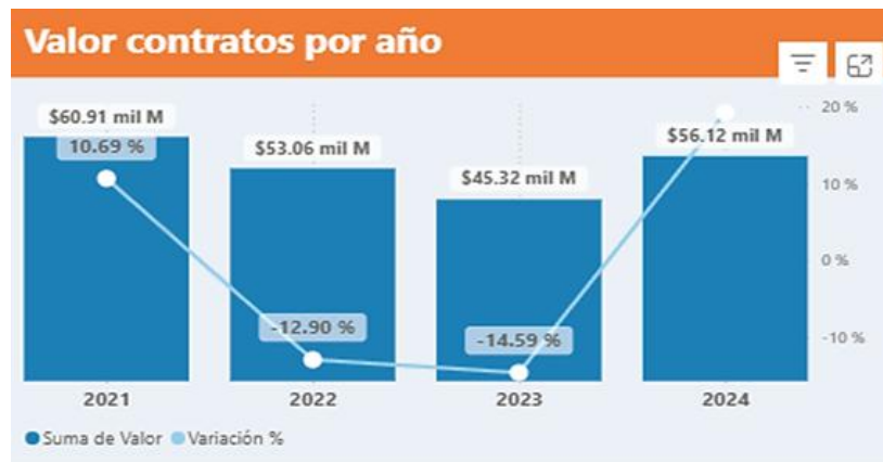
Gráfico. Gasto anual categoría de servicios culturales y becas. Cifras en miles de millones COP