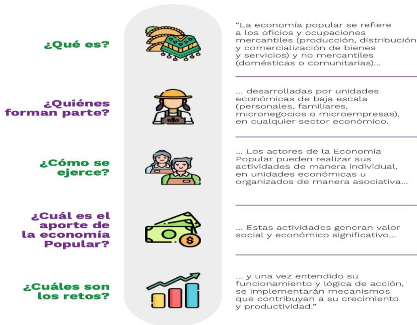
Ilustración 7. Actores de la Economía Popular