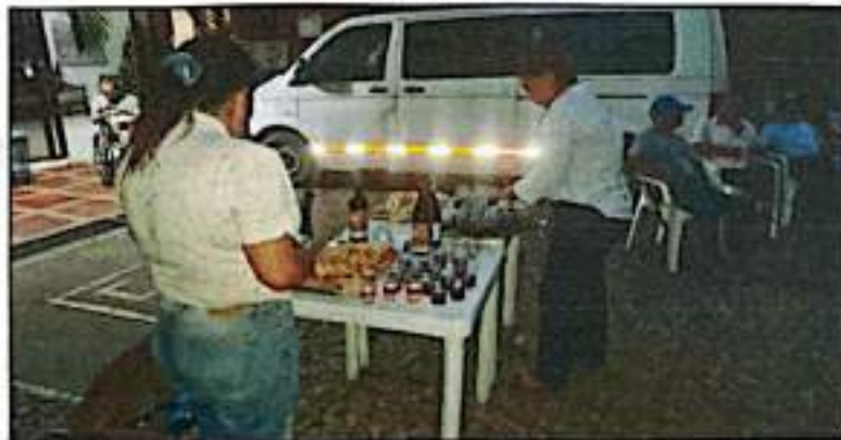
Actividad integración noche de las velitas