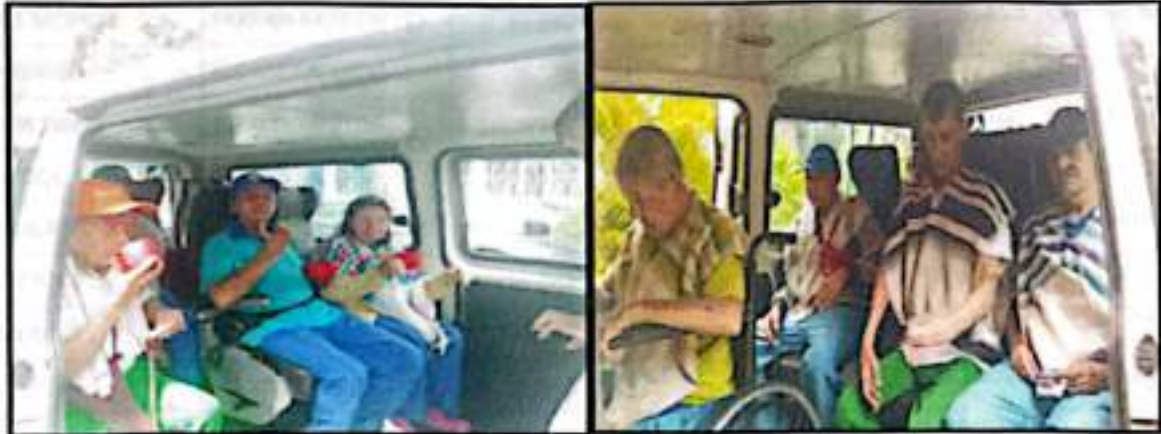
Traslado en vehículo de la Corporación de los beneficiarios del programa diferentes actividades