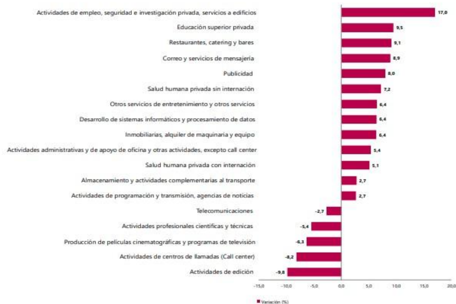
Gráfico 1. Variación anual de los ingresos nominales, según subsector de servicios Total nacional Octubre 2025 P / octubre 2024