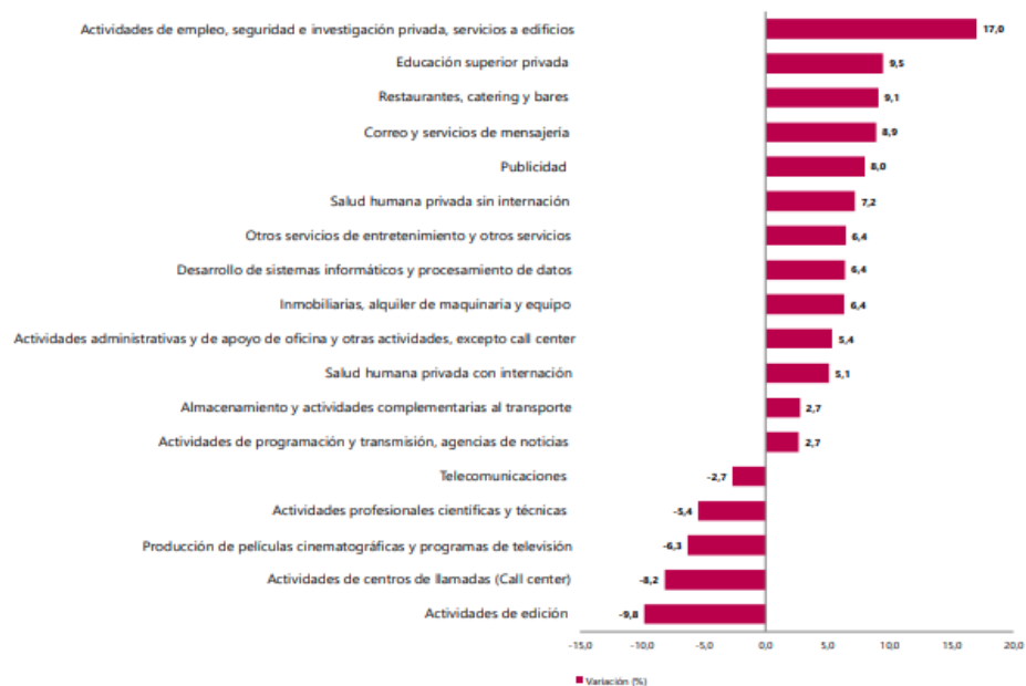
Gráfico 1. Variación anual de los ingresos nominales, según subsector de servicios Total nacional Octubre 2025 P / octubre 2024