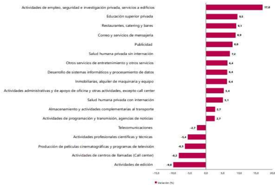
Gráfico 1. Variación anual de los ingresos nominales, según subsector de servicios Total nacional Octubre 2025 P / octubre 2024