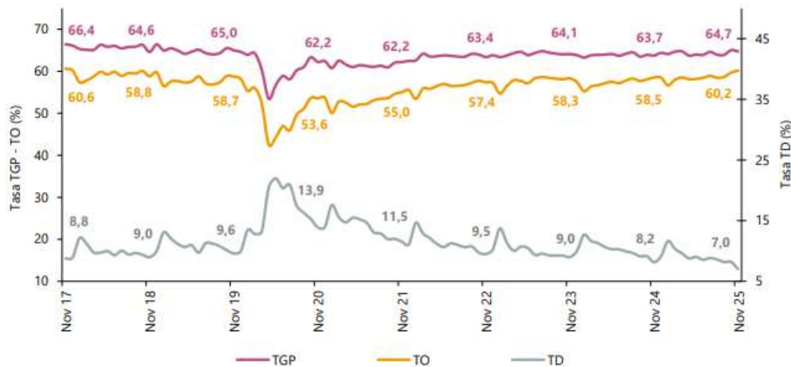
Gráfico 2. Tasa global de participación (TGP), Tasa de ocupación (TO) y Tasa de desocupación (TD) Total nacional Noviembre (2017 - 2025)

tasa global de participación se ubicó en 64,7%, lo que significó un aumento de 1,0 puntos porcentuales frente a noviembre de 2024 (63,7%). Finalmente, la tasa de ocupación fue 60,2%, lo que representó un aumento de 1,6 puntos porcentuales respecto al mismo mes del año anterior (58,5%).