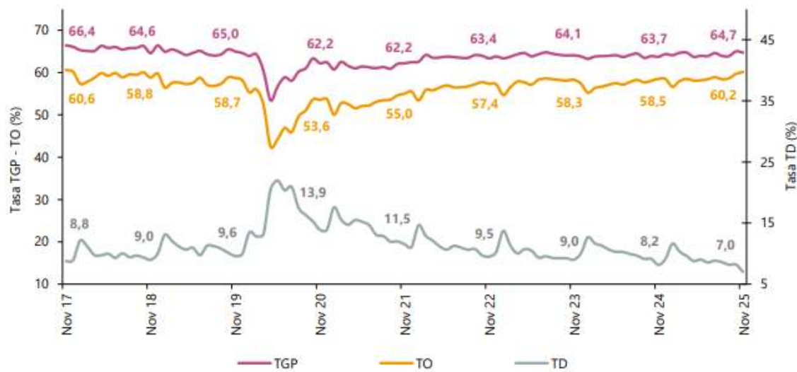
Gráfico 2. Tasa global de participación (TGP), Tasa de ocupación (TO) y Tasa de desocupación (TD) Total nacional Noviembre (2017 - 2025)

representó una disminución de 1,1 puntos porcentuales respecto al mismo mes de 2024 (8,2%). La tasa global de participación se ubicó en 64,7%, lo que significó un aumento de 1,0 puntos porcentuales frente a noviembre de 2024 (63,7%). Finalmente, la tasa de ocupación fue 60,2%, lo que representó un aumento de 1,6 puntos porcentuales respecto al mismo mes del año anterior (58,5%).