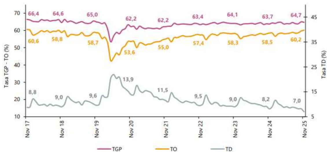
Gráfico 2. Tasa global de participación (TGP), Tasa de ocupación (TO) y Tasa de desocupación (TD) Total nacional Noviembre (2017 - 2025)

representó una disminución de 1,1 puntos porcentuales respecto al mismo mes de 2024 (8,2%). La tasa global de participación se ubicó en 64,7%, lo que significó un aumento de 1,0 puntos porcentuales frente a noviembre de 2024 (63,7%). Finalmente, la tasa de ocupación fue 60,2%, lo que representó un aumento de 1,6 puntos porcentuales respecto al mismo mes del año anterior (58,5%).