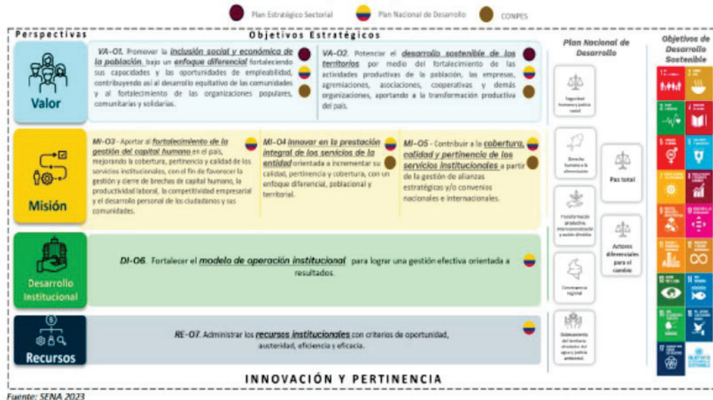
Ilustración 4. Mapa Estratégico Institucional

El Mapa Estratégico Institucional del SENA constituye el núcleo estructural del Plan Estratégico Institucional 2023-2026, integrando de manera articulada cuatro perspectivas y siete objetivos estratégicos, operacionalizados a través de un conjunto de indicadores de gestión, metas institucionales e iniciativas clave. Esta arquitectura estratégica permite direccionar la operación de la entidad hacia el cumplimiento de su misión y visión institucional, al tiempo que garantiza la alineación con las prioridades de gobierno, transformaciones y catalizadores definidos en el Plan Nacional de particularmente con las Desarrollo 2022-2026 "Colombia Potencia Mundial de la Vida".