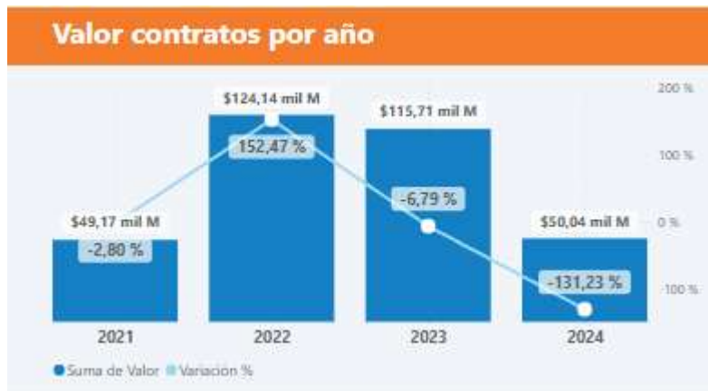
Gráfico. Valor histórico necesidades de la categoría de Servicios Profesionales cifras en miles de millones COP