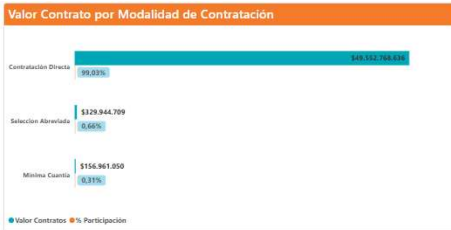
Gráfico. Participación por modalidad de contratación categoría de Servicios profesionales 2024