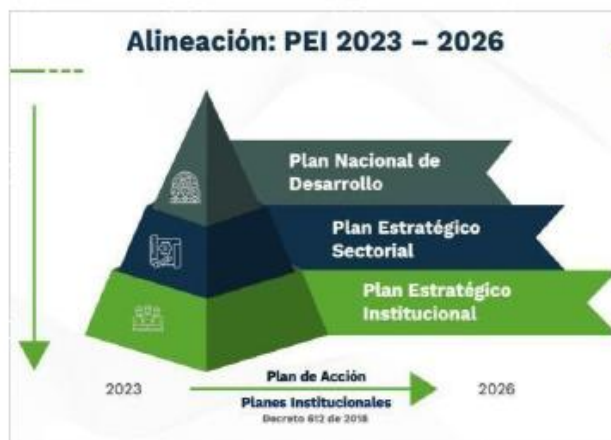
Ilustración 2 Alineación normativa PEI 2023 – 2026

En atención al marco regulatorio vigente y al contexto nacional e internacional actual, la entidad elaboró su modelo de alineación estratégica con el fin de orientar la ruta institucional para cumplir los retos y compromisos de largo aliento, con miras a garantizar la creación de valor publico satisfaciendo las necesidades y atendiendo las necesidades de los ciudadanos destinatarios de sus servicios.