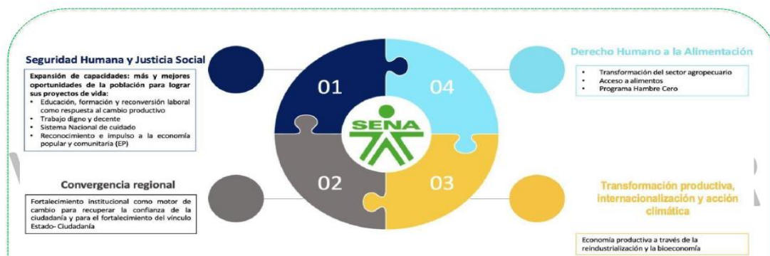
Ilustración 4 Alineación con Plan Nacional de Desarrollo 2022 – 2026

El SENA por su misionalidad y presencia a nivel nacional tiene relación con todas las transformaciones; sin embargo, su alineación principal está con la transformación de Seguridad Humana y Justicia Social, seguidas por las transformaciones de Seguridad Alimentaria, Transformación Productiva y la Convergencia Regional, conectadas a los actores diferenciales del cambio