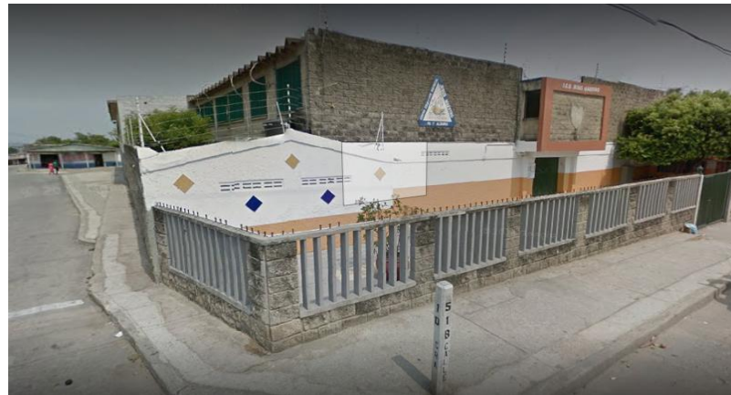
Figura 2. Ubicación de la IED

Actualmente la IED JESUS MAESTRO atiende 905 1 estudiantes en los grados de transición a once (ver cuadro reporte de matrícula); población afectada debido a los cambios permanentes generados durante los