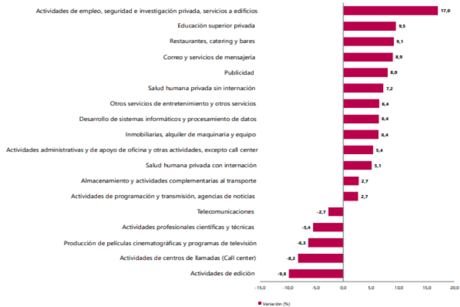
Gráfico 1. Variación anual de los ingresos nominales, según subsector de servicios Total nacional Octubre 2025 P / octubre 2024