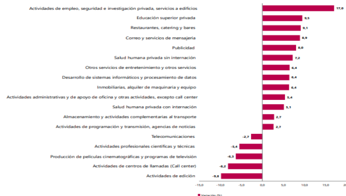
Gráfico 1. Variación anual de los ingresos nominales, según subsector de servicios Total nacional Octubre 2025 P / octubre 2024