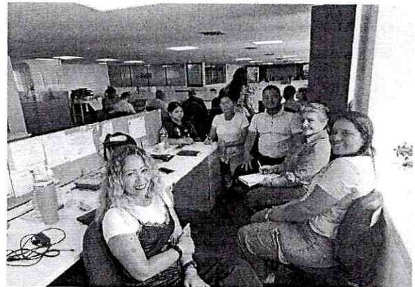
BORRADOR DEL PLAN DE ACCION DE SARLAFT 2024