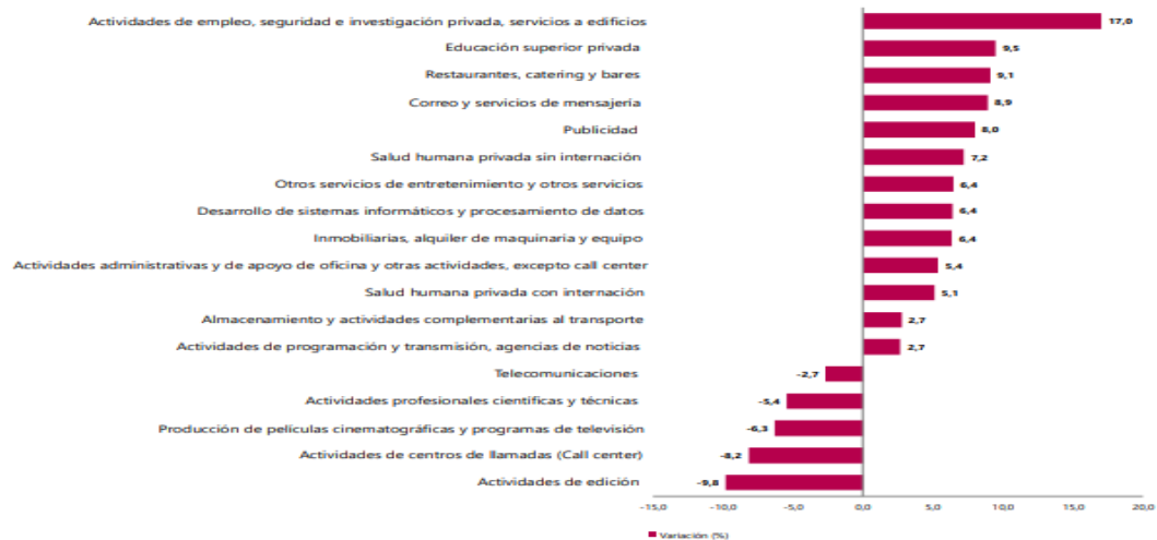
Gráfico 1. Variación anual de los ingresos nominales, según subsector de servicios Total nacional Octubre 2025 P / octubre 2024