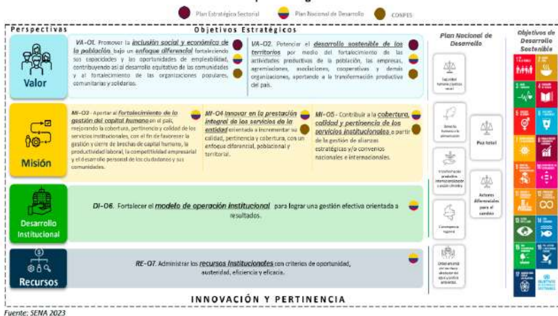
Ilustración 4. Mapa Estratégico Institucional

El Mapa Estratégico Institucional del SENA constituye el núcleo estructural del Plan Estratégico Institucional 2023–2026, integrando de manera articulada cuatro perspectivas y siete objetivos estratégicos, operacionalizados a través de un conjunto de indicadores de gestión, metas institucionales e iniciativas clave. Esta arquitectura estratégica permite direccionar la operación de la entidad hacia el cumplimiento de su misión y visión institucional, al tiempo que garantiza la alineación con las prioridades de gobierno, particularmente con las transformaciones y catalizadores definidos en el Plan Nacional de Desarrollo 2022–2026 “Colombia Potencia Mundial de la Vida”.