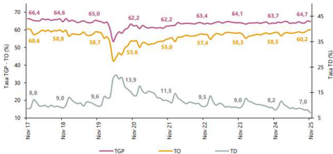
Gráfico 2. Tasa global de participación (TGP), Tasa de ocupación (TO) y Tasa de desocupación (TD) Total nacional Noviembre (2017 - 2025)

tasa global de participación se ubicó en 64,7%, lo que significó un aumento de 1,0 puntos porcentuales frente a noviembre de 2024 (63,7%). Finalmente, la tasa de ocupación fue 60,2%, lo que representó un aumento de 1,6 puntos porcentuales respecto al mismo mes del año anterior (58,5%).