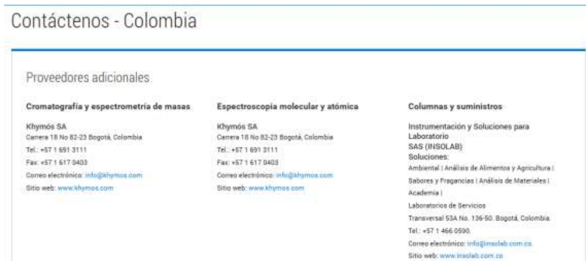
Figura 1. Distribuidores Agilent en Colombia

Fuente: https://www.agilent.com/en/contact-us/colombia Diciembre de 2025