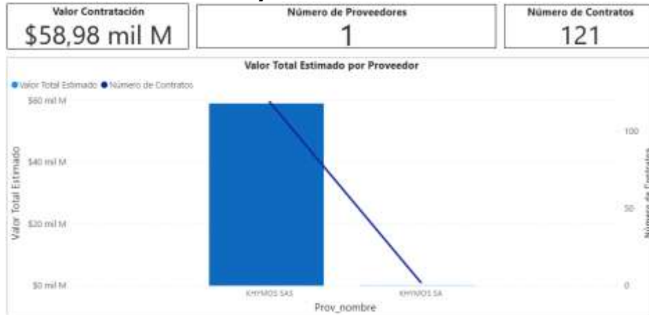
Gráfica 2. Cantidad y valor de contrato KHYMOS S.A.S