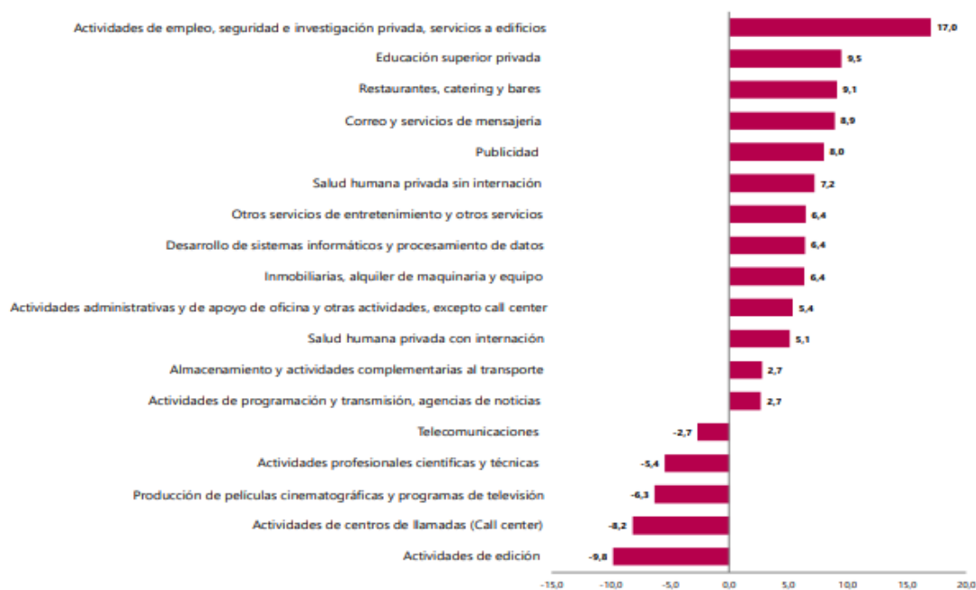
Gráfico 1. Variación anual de los ingresos nominales, según subsector de servicios Total nacional Octubre 2025 P / octubre 2024