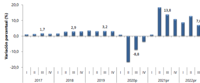
Gráfico 1. Producto Interno Bruto Tasa de crecimiento en volumen 1 2017-I / 2022 pr - III