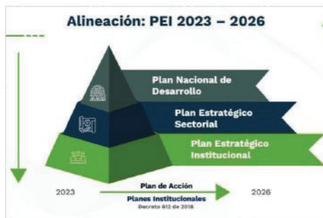
Ilustración 2 Alineación normativa PEI 2023 – 2026

El Plan estratégico institucional atiende el marco regulatorio de la planeación en el país, que señala como todas las entidades deben formular su plan estratégico de acuerdo con el plan nacional de desarrollo. La Ley 152 de 1994 señala como cada uno de los organismos públicos, con base en los lineamientos del Plan Nacional de Desarrollo y de las funciones que le señale la ley, deberá elaborar un plan indicativo cuatrienal (plan estratégico) con planes de acción anuales que se constituirá en la base para la posterior evaluación de resultados. Así mismo, el Decreto 612 de 2018 señala las directrices para la integración de los planes institucionales y estratégicos al Plan de Acción por parte de las entidades del Estado.