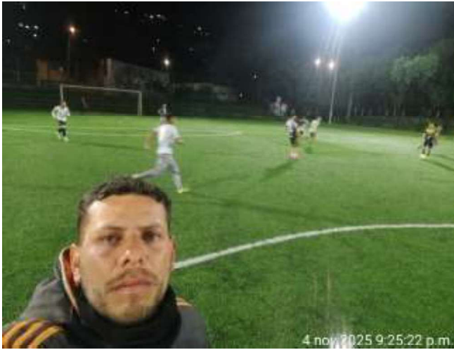
LUGAR: ESCENARIO GRUPO BOSQUE SAN CARLOS