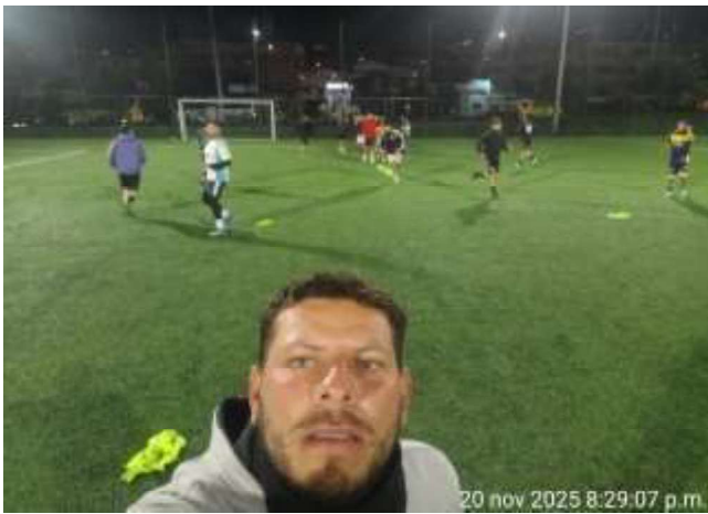
LUGAR: ESCENARIOPIJAOS GRUPO PIJAOS