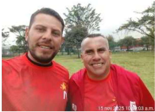
LUGAR: ESCENARIO GRUPO TUNAL