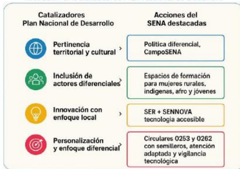
Ilustración 3. Catalizadores Plan Nacional de Desarrollo

En este contexto, el Servicio Nacional de Aprendizaje (SENA), como entidad del orden nacional adscrita al Ministerio del Trabajo con responsabilidad directa en la formación profesional integral, la promoción del empleo, el emprendimiento y la innovación, participa activamente en la implementación del Plan Nacional de Desarrollo mediante la ejecución de proyectos de inversión, programas misionales y acciones articuladas con los catalizadores y transformaciones definidas en el Plan Nacional de Desarrollo - PND, con énfasis en la transformación de Seguridad Humana y Justicia Social, y con acciones transversales en las demás transformaciones, especialmente con el enfoque de pertinencia territorial y cultural, y la inclusión de actores diferenciales (campesinos, jóvenes, mujeres, comunidades étnicas, personas con discapacidad, entre otros).