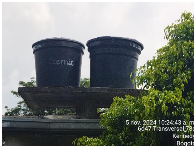
Ilustración 2 Tanques de almacenamiento de agua

El agua que se almacena en el tanque es para los baños.