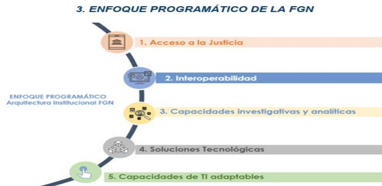
Figura 2: Enfoque programático FGN