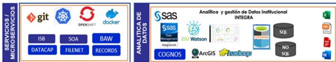
Figura 5: Componentes de Software IBM

Entre los habilitadores tecnológicos del Ecosistema que soportan la Gestión de Contenido Documental se tienen productos del fabricante IBM, mediante los cuales se desarrollan las funcionalidades requeridas para atender, entre otras las necesidades de los proyectos: a) Sede electrónica de la FGN. b) Gestor de contenido Documental de la FGN. c) Modelamiento de Procesos priorizados de la FGN, así como el desarrollo de servicios y microservicios, necesarios para la integración de sistemas de información, interoperabilidad y servicios de información. Los productos y plataformas de IBM están orientados principalmente a la automatización, integración, gestión de datos, analítica y soporte especializado para operar procesos misionales como la atención de denuncias en Denuncia Fácil (SICECON), en sus ambientes de producción y pruebas, así como la integración de aplicaciones y servicios, la comunicación entre sistemas como: SPOA, SAITH, KACTUS, SIJYP, SUIP y servicios externos con Registraduría, Policía Nacional y Medicina Legal: