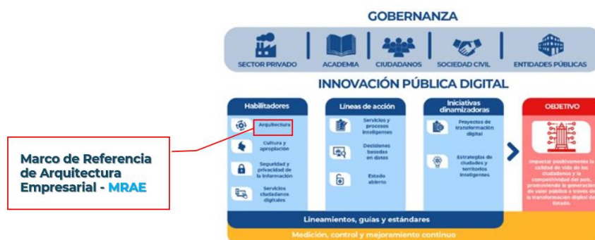
Figura 1: Elementos que componen la estructura de la Política de Gobierno Digital

En línea con lo expuesto, la Entidad busca fortalecer sus capacidades institucionales y de gestión tecnológica, mediante el enfoque de Arquitectura Empresarial del Estado, como instrumento que establece la estructura conceptual, definiendo lineamientos e incorporando las mejores prácticas para su transformación digital. En el marco de las iniciativas de arquitectura de TI de la Fiscalía General de la Nación, se ha desarrollado el Plan Estratégico de Tecnologías PETI 2025-2028. Este plan adopta un enfoque programático estructurado en cinco (5) programas, en consonancia con la organización de la entidad. El objetivo principal es clasificar, formular, designar y optimizar los recursos físicos, técnicos, humanos y presupuestales. De esta manera, se busca garantizar la eficacia, eficiencia y efectividad de los procesos institucionales, al tiempo que se genera valor a través de soluciones innovadoras en Tecnologías de la Información y las Comunicaciones.