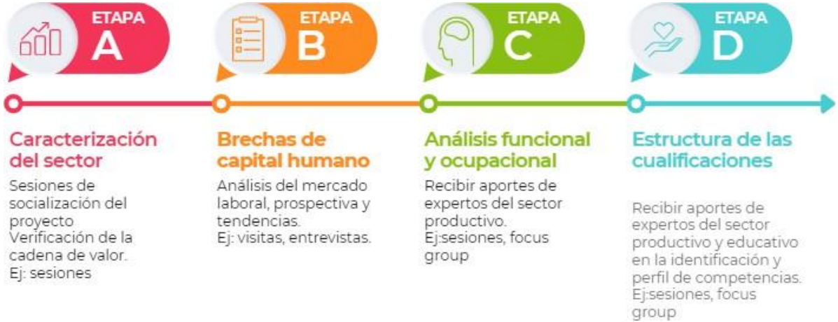
Figura 6. Representación gráfica de las estrategias de participación por cada una de las etapas de la ruta metodológica del MNC.