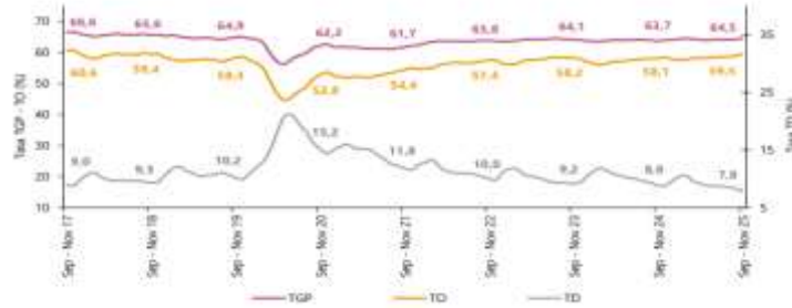
Gráfico 4. Tasa global de participación (TGP), Tasa de ocupación (TO) y Tasa de desocupación (TD) Total nacional Septiembre - noviembre (2017 - 2025)

En el total nacional, la tasa de desocupación del trimestre móvil septiembre - noviembre 2025 fue 7,8%, lo que representó una disminución de 1,0 puntos porcentuales respecto al trimestre móvil septiembre - noviembre 2024 (8,8%). La tasa global de participación se ubicó en 64,5%, lo que significó un aumento de 0,8 puntos porcentuales frente al mismo periodo de 2024 (63,7%). Finalmente, la tasa de ocupación fue 59,5%, lo que representó un aumento de 1,4 puntos porcentuales respecto al trimestre móvil septiembre - noviembre 2024 (58,1%).