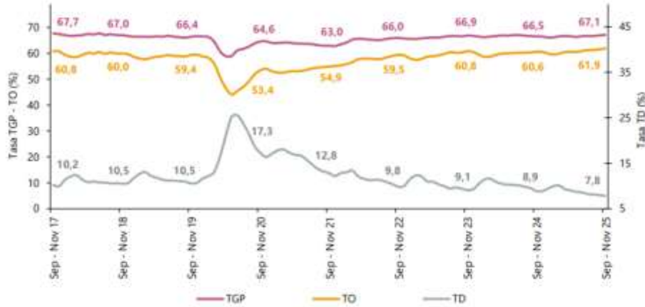
Gráfico 5. Tasa global de participación (TGP), Tasa de ocupación (TO) y Tasa de desocupación (TD) Total 13 ciudades y áreas metropolitanas Septiembre - noviembre (2017 - 2025)