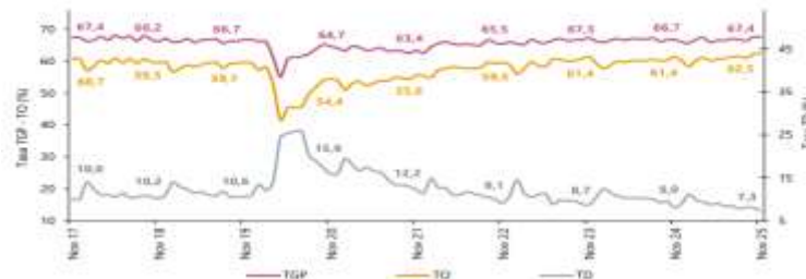
Gráfico 3. Tasa global de participación (TGP), Tasa de ocupación (TO) y Tasa de desocupación (TD) Total 13 ciudades y áreas metropolitanas Noviembre (2017 - 2025)

En noviembre de 2025, la tasa de desocupación en el total de las 13 ciudades y áreas metropolitanas fue 7,3%, mientras que en noviembre de 2024 fue 8,0%. La tasa global de participación se ubicó en 67,4% y la tasa de ocupación en 62,5%, estas tasas en el mismo mes del año anterior fueron 66,7% y 61,4%, respectivamente.