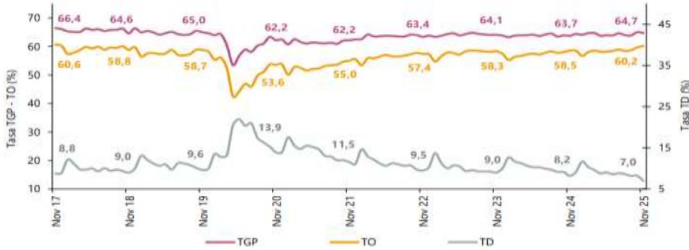
Gráfico 1. Tasa global de participación (TGP), Tasa de ocupación (TO) y Tasa de desocupación (TD) Total nacional Noviembre (2017 - 2025)

Fuente: DANE, Gran Encuesta Integrada de Hogares (GEIH).