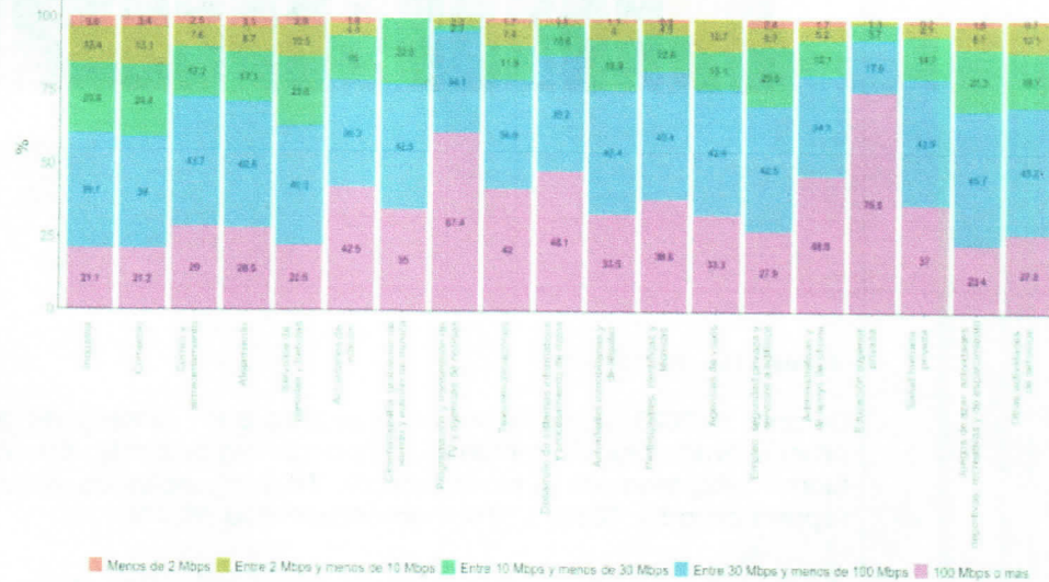
Gráfico 9. Porcentaje de empresas según la máxima velocidad con la cual se conectan a internet Total nacional 2020

Como se ve en el gráfico 9, durante el 2020 la velocidad de conexión a internet predominante en los sectores industria y comercio fue entre 30 Mbps y menos de 100 Mbps, con una participación del 39,1% y 38,0%, respectivamente. Sin embargo, en varios subsectores de servicios se observó en el 2020 una mayor proporción de empresas con velocidades de conexión superiores a 100 Mbps, como lo fueron Programación y transmisión de TV y agencias de noticias (61,4%).