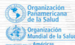
Dr. Jarbas Barbosa da Silva Jr. Director