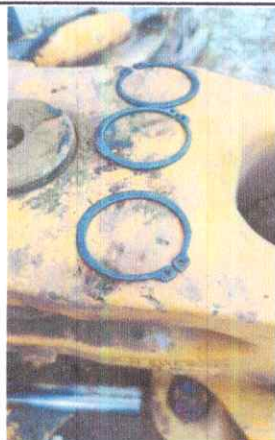
ANEXO 01. Pines para pasador botella giro de ojo