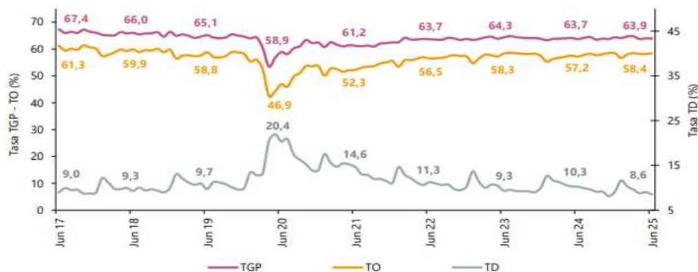
Gráfico 2. Tasa global de participación (TGP), Tasa de ocupación (TO) y Tasa de desocupación (TD) Total nacional Junio (2017 - 2025)

Para el mes de junio de 2025, la tasa de desocupación del total nacional fue 8,6%, lo que representó una disminución de 1,7 puntos porcentuales respecto al mismo mes de 2024 (10,3%). La tasa global de participación se ubicó en 63,9%, mientras que en junio de 2024 fue 63,7%. Finalmente, la tasa de ocupación fue 58,4%, lo que representó un aumento de 1,3 puntos porcentuales respecto al mismo mes de 2024 (57,2%).