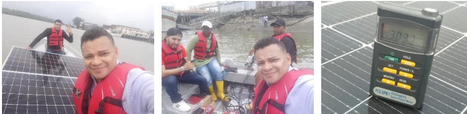
Figura 1. Pruebas realizadas en la embarcación tipo canoa

Se realizaron pruebas de potencia del motor eléctrico en diferentes escenarios de carga, midiendo la capacidad del sistema para mantener velocidades constantes en diversas condiciones del agua y carga útil. Durante los recorridos en el agua, se monitorearon parámetros como tiempo de recorrido, autonomía del sistema eléctrico, consumo energético por kilómetro recorrido y rendimiento general del sistema.