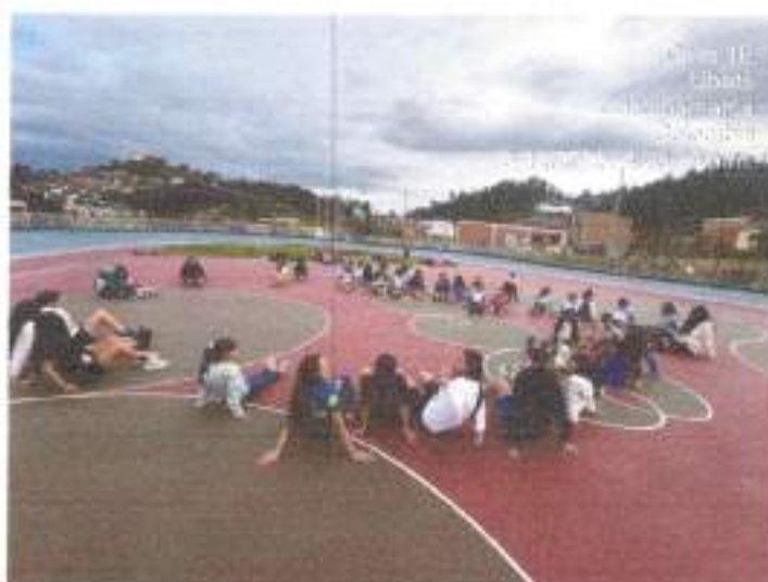
REGISTRO FOTOGRÁFICO: N° 4 LUGAR: PATINODROMO BARRIO SAN JOSE FECHA: 03/12/2025