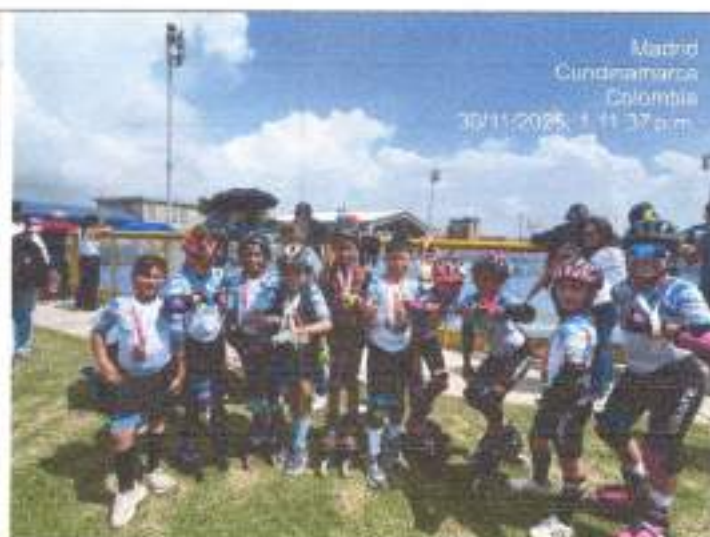
REGISTRO FOTOGRÁFICO: N° 3 LUGAR: PATINODROMO MADRID FECHA: 30/11/2025

FOTO 4 OBLIGACIÓN 7 Presentar un plan semanal de sesiones de clases el cual deberá ser aprobado por el supervisor del Contrato.