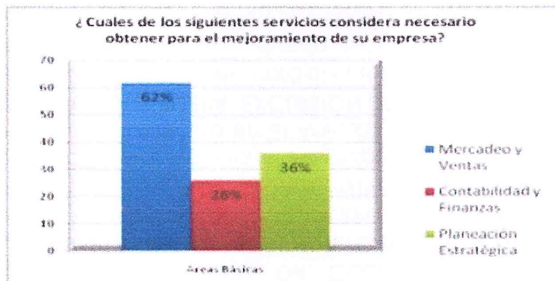
Ilustración 6. Servicios de Asesoría y Consultoría en Áreas Básicas

Servicios en áreas básicas En cuanto a la necesidad de los servicios de asesoría y consultoría en áreas básicas para el funcionamiento de una empresa como lo son el área de mercadeo y ventas, contabilidad y finanzas y planeación estratégica, el 62 % de las micro y pequeñas empresas encuestadas considera que necesita obtener servicios en el área de mercadeo y ventas frente a un 36% que prefirió el área de planeación estratégica y en un último lugar se encuentra un 26% en contabilidad y finanzas, así como lo evidencia el siguiente gráfico.