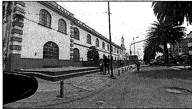
Ilustración 2. Identificación de estructura.

La Institución Educativa Técnico Comercial Sagrado Corazón de Jesús de Chiquinquirá, ubicado en la carrera 10 N° 25-61, Chiquinquirá, Boyacá.