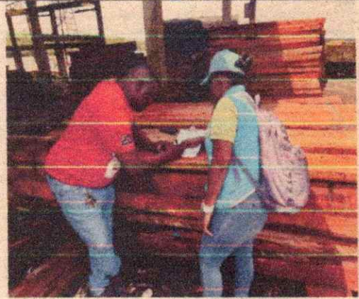
Imagen 10. Levantamiento de la información