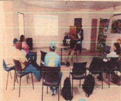
Imagen 20. Reunión interinstitucional entre el EPA Buenaventura, CIFF Valle, CVC y MinAmbiente