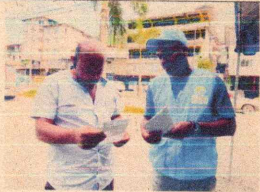
Imagen 18. Taller No.4