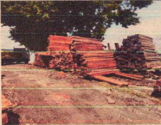
Imagen 9. Patios, bodegas