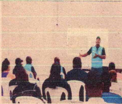
Imagen 15. Taller No1.