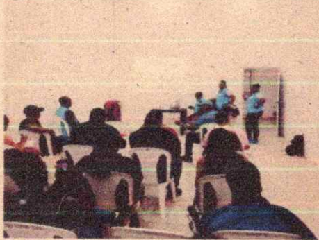
Imagen 17. Taller No.3