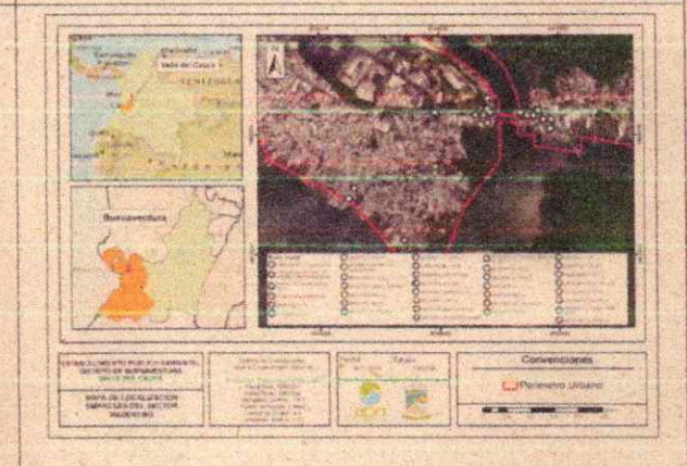
Imagen 8. Mapa de cada unidad productiva