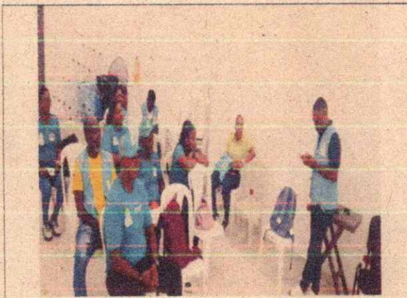
Imagen 5. Socialización del plan operativo