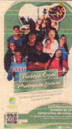
Imagen 14. Pendón conmemorativo de la actividad