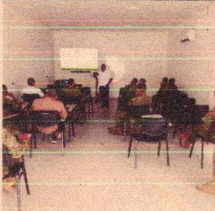
Imagen 19. Reunión interinstitucional entre el EPA Buenaventura y la Armada Nacional de Colombia