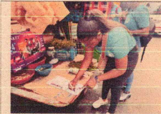
Imagen 13. Levantamiento de la información y sensibilización ambiental