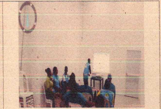
Imagen 6. Socialización del plan operativo