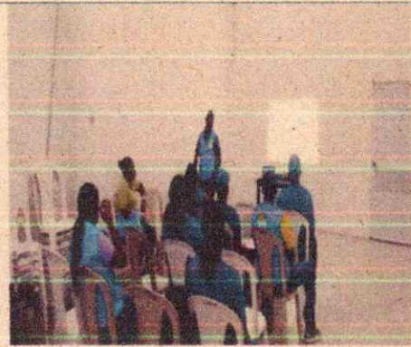
Imagen 3. Socialización del plan operativo