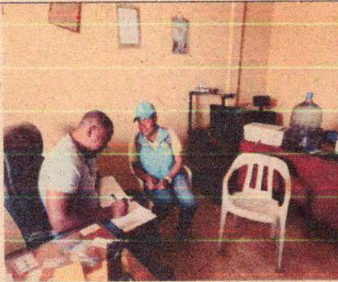
Imagen 11. Visita de seguimiento a establecimientos de comercialización forestal