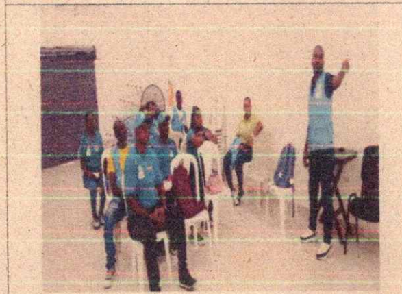
Imagen 7. Socialización del plan operativo