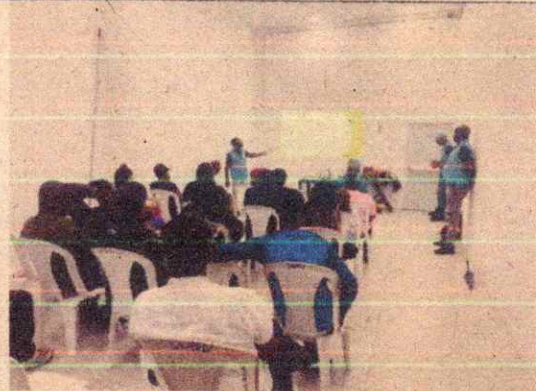
Imagen 16. Taller No.2