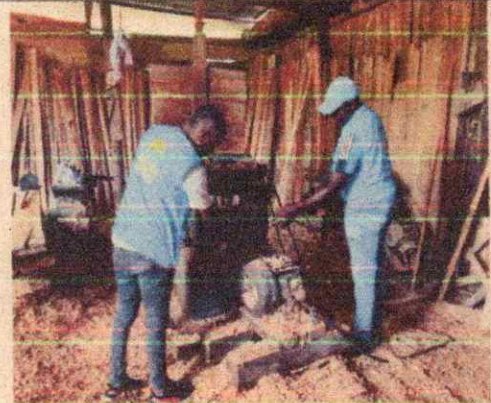
Imagen 12. Visita de seguimiento a empresas de transformación primaria y secundaria de productos forestales