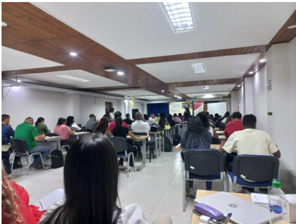
Inducción Día 27 de febrero de 2026