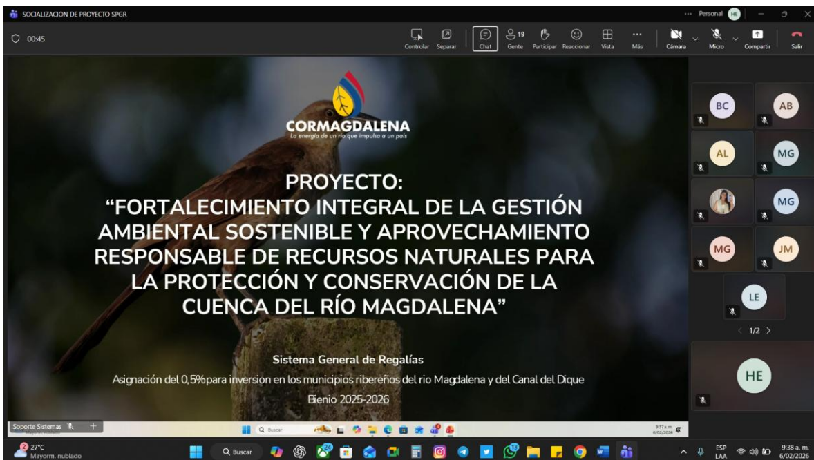
Imagen No 1, socialización del proyecto.